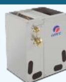
SERPENTIN EN A